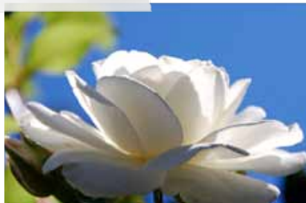
Rosa 'Climbing Iceberg' bloeit twee keer per jaar.