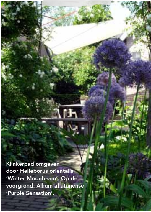
Klinkerpad omgeven door Helleborus orientalis 'Winter Moonbeam'. Op de voorgrond: Allium aflatunense 'Purple Sensation'.